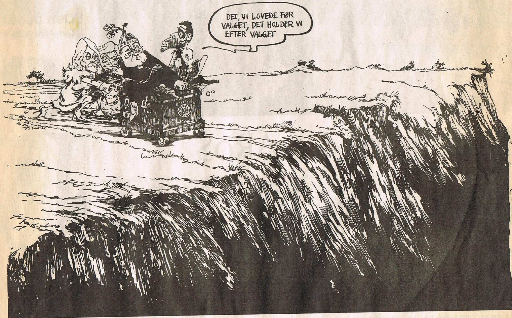
De økonomiske vismænd advarer om, at Danmarks økonomi er på vej mod afgrunden. Tegning: Roald Als